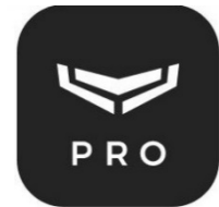
Installatør desktop program til laptop